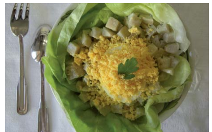
ŒUF MIMOSA & ARTICHAUTS*