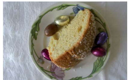
MOUNA & ŒUFS AU CHOCOLAT

* PRODUITS EN VENTE CHEZ CARNIVOR SELON LES STOCKS DISPONIBLES