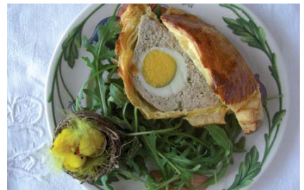
PÂTÉ DE PÂQUES