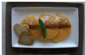
ORANGES À LA CANELLE

* PRODUITS EN VENTE CHEZ CARNIVOR SELON LES STOCKS DISPONIBLES AUTRES PRODUITS EN VENTE CHEZ VOTRE ÉPICIER