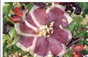
SALADE DE MAGRET DE CANARD FUME*