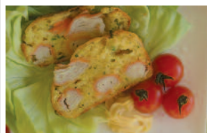
CAKE AU SURIMI*