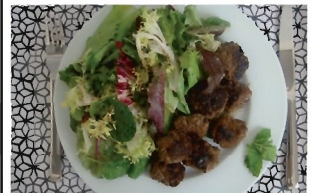
BOULETTES À MA FAÇON